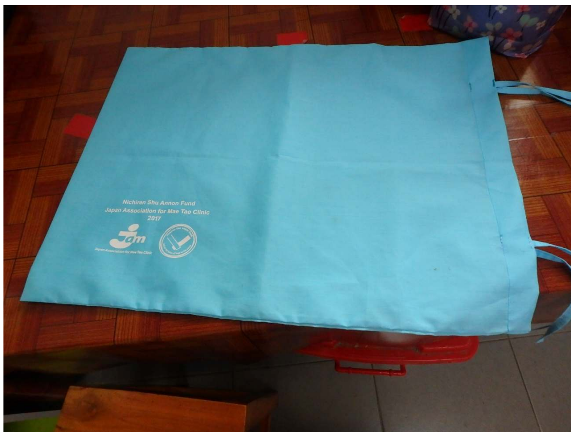
完成した枕カバー。あんのん基金様のご支援で作成しました。