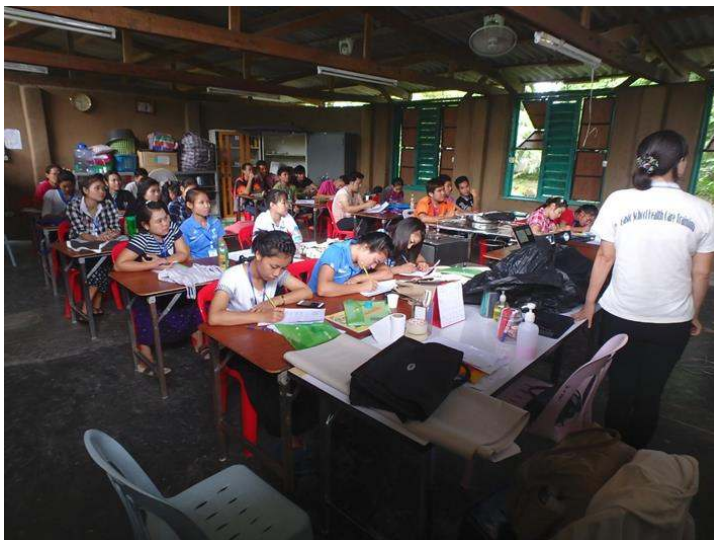
看護研修での講義の様子

http://maetaoclinic.org/publications/annual-reports