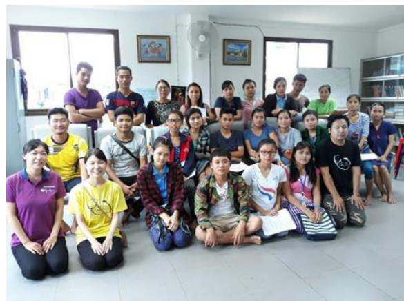
看護トレーニング中の看護スタッフ