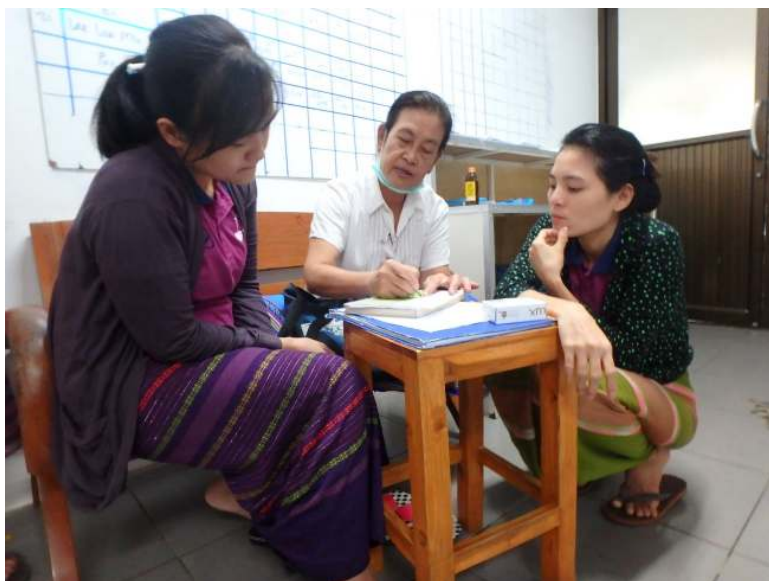
看護記録の方法を指導しています。