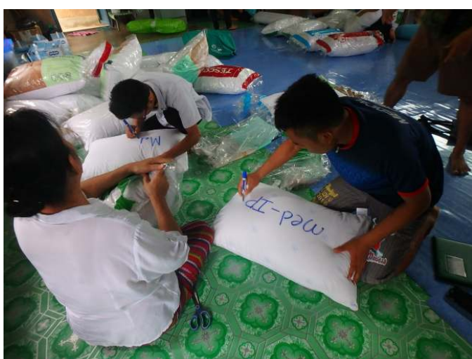
JAMより寄付した枕を外科と内科病棟で分けています