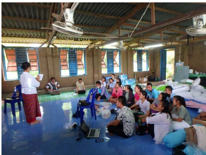
7月に開催した看護スタッフ会議の様子