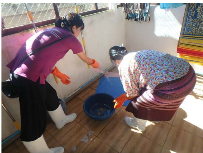
汚れてしまったシーツを洗っています。どのように洗うかは今後の検討課題です。