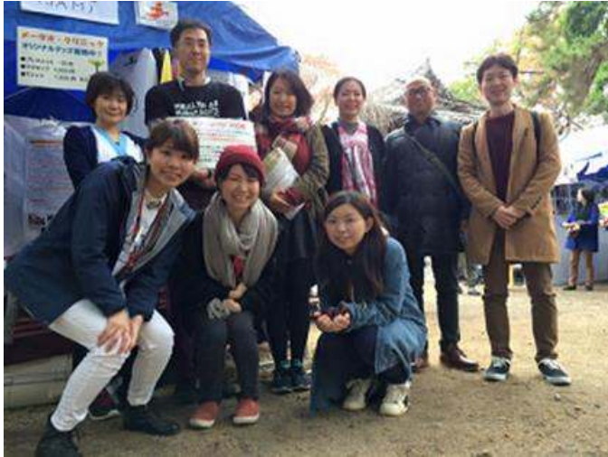
(昨年のミャンマー祭りにて)