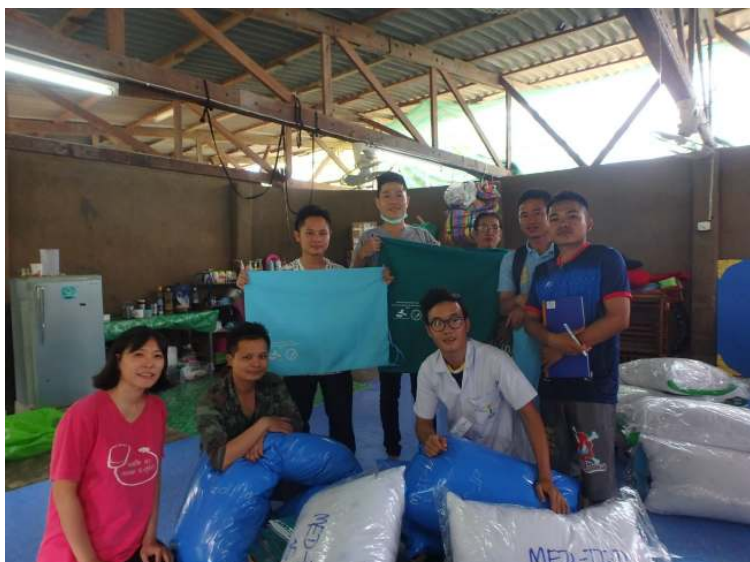
会議のあとに残って作業してくれたスタッフのみんなと。