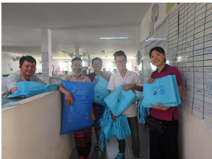
完成した枕カバーを内科病棟に寄付しました。