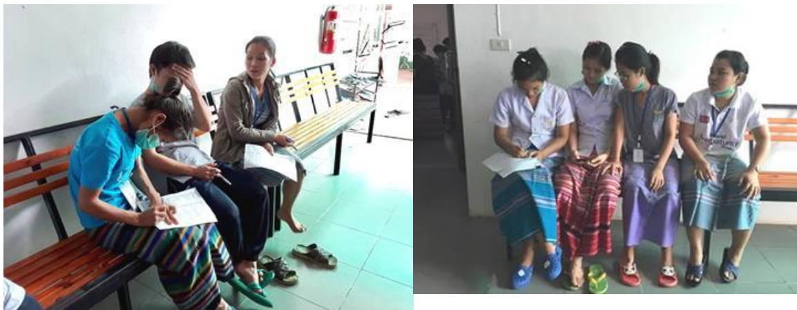
(↑写真1 (2枚とも) :創部のアセスメントをしている様子)

そのため、研修生が患者さんの反応にびっくりして固まったり焦って間違えてしまうので、実際に患者さんへ処置を行う前に研修生同士で練習を行いました。(写真：1, 2)