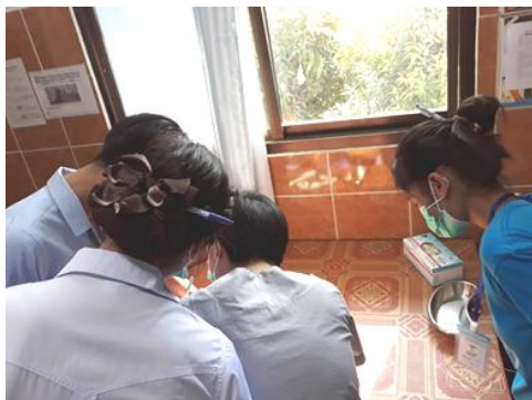
(↑写真2 :創部処置の練習)